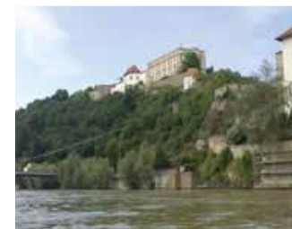
KM 2225, Passau

Herrliche Landschaften und einzigartige Natur macht Ihre Bootstour zu einem unvergesslichen Urlaub.