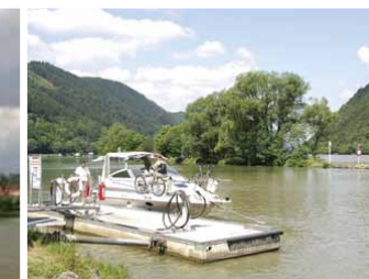
Die Tankstelle in Schlögen