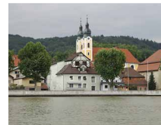
KM 2210, Oberzell