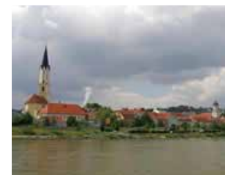
KM 2248, Vilshofen