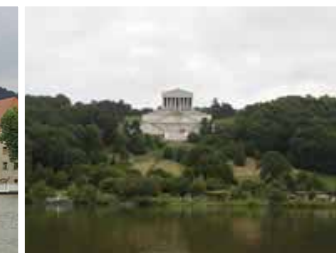
Ankerplatz bei Walhalla