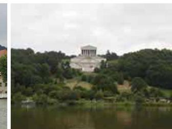
Ankerplatz bei Walhalla